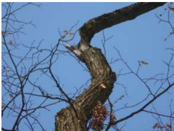
Lipa drobnolistna nr inw. 37