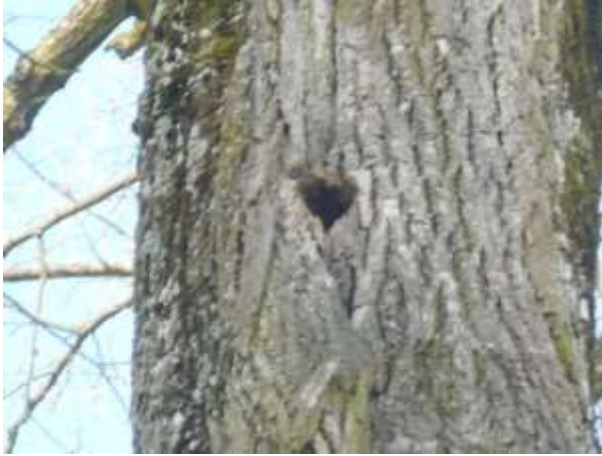
Lipa drobnolistna nr inw. 15