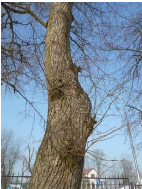
Lipa drobnolistna nr inw. 36