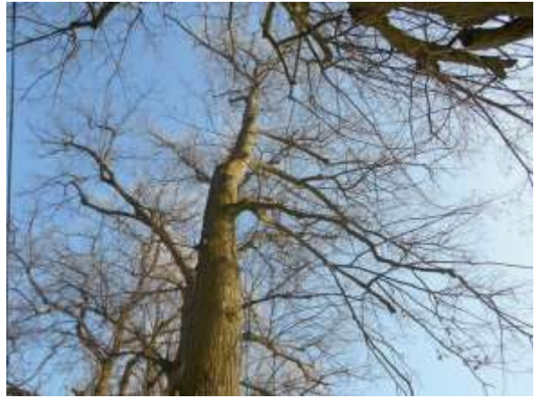
Lipa drobnolistna nr inw. 19