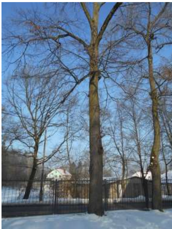
Lipa drobnolistna nr inw. 13