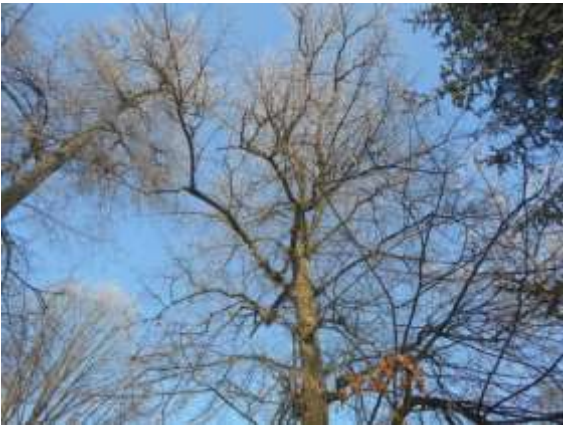
Lipa drobnolistna nr inw. 12