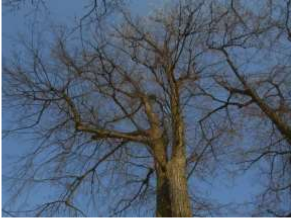
Lipa drobnolistna nr inw. 33