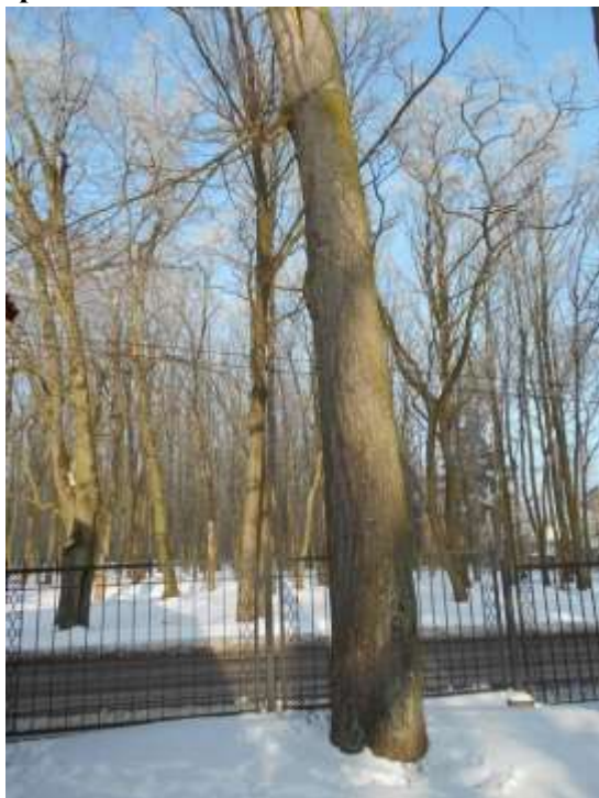
Lipa drobnolistna nr inw. 1