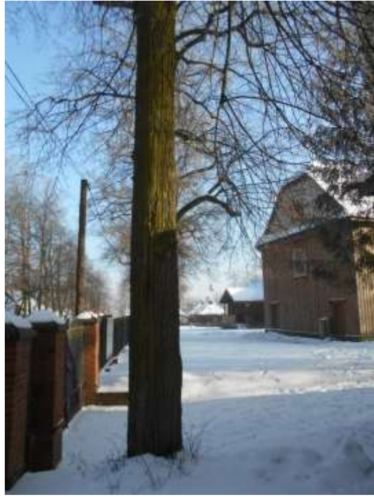
Lipa drobnolistna nr inw. 11