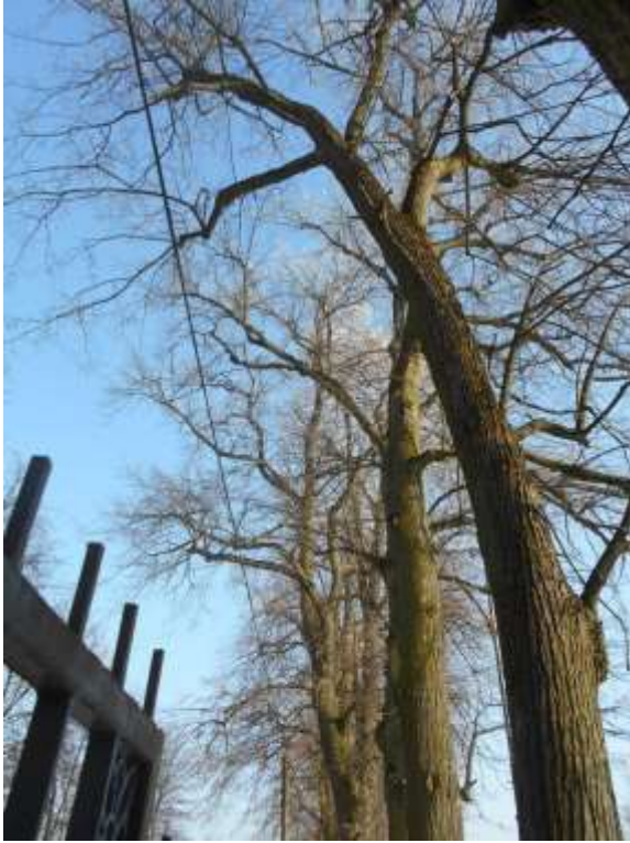
Lipa drobnolistna nr inw. 18