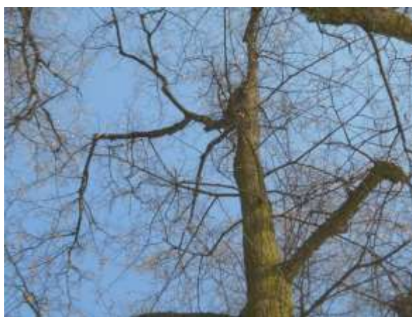
Lipa drobnolistna nr inw. 35