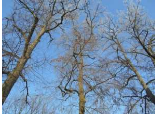
Lipa drobnolistna nr inw. 14