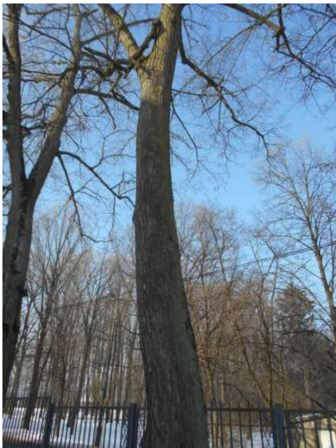
Lipa drobnolistna nr inw. 16