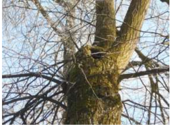
Lipa drobnolistna nr inw. 10