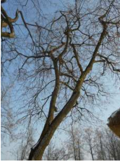
Lipa drobnolistna nr inw. 38