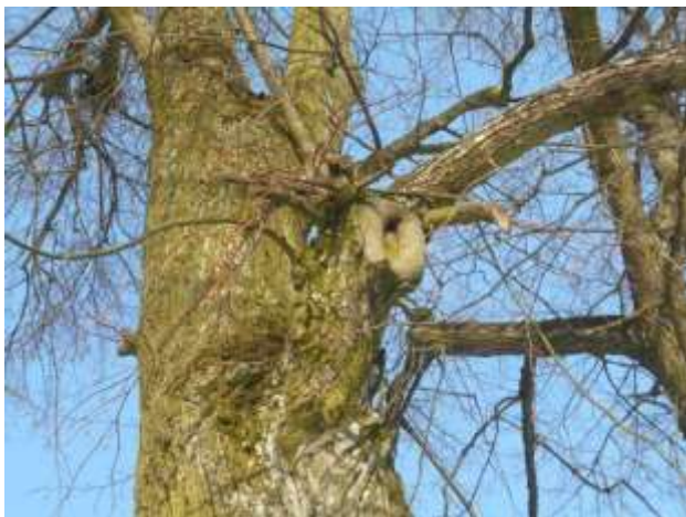
Lipa drobnolistna nr inw. 27