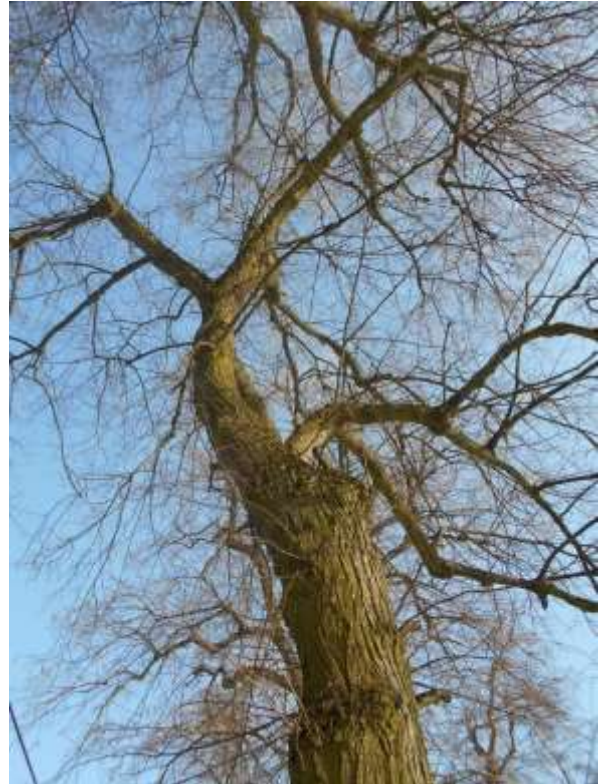
Lipa drobnolistna nr inw. 28