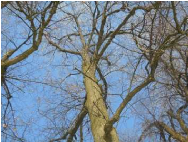
Lipa drobnolistna nr inw. 24