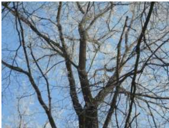
Lipa drobnolistna nr inw. 6