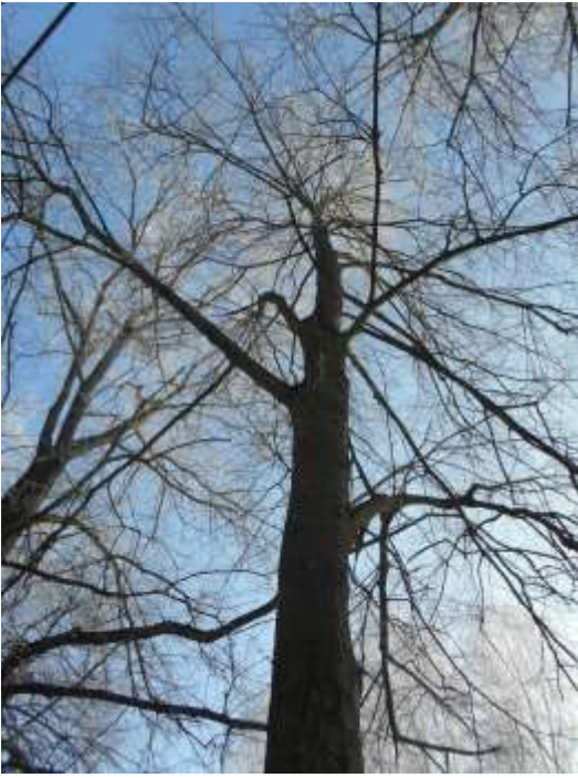
Wiąz szypułkowy nr inw. 5