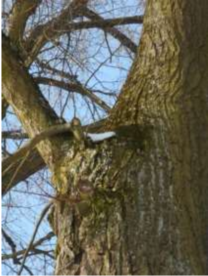
Lipa drobnolistna nr inw. 26