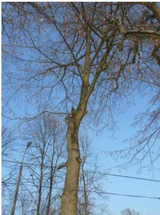
Lipa drobnolistna nr inw. 29