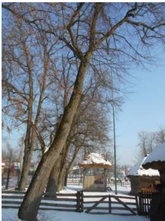
Lipa drobnolistna nr inw. 31