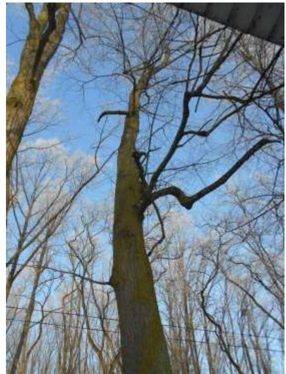
Lipa drobnolistna nr inw. 4