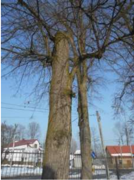
Lipa drobnolistna nr inw. 32