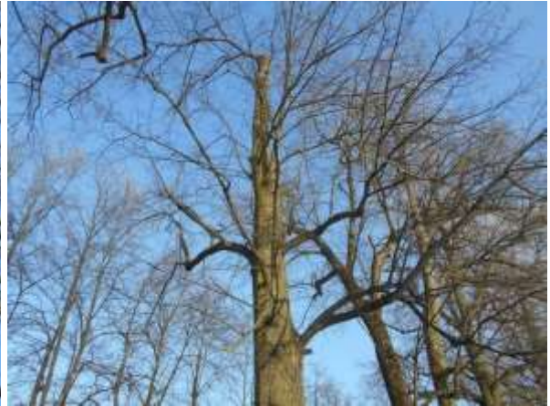
Lipa drobnolistna nr inw. 17