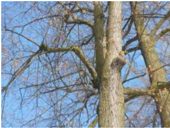
Lipa drobnolistna nr inw. 23