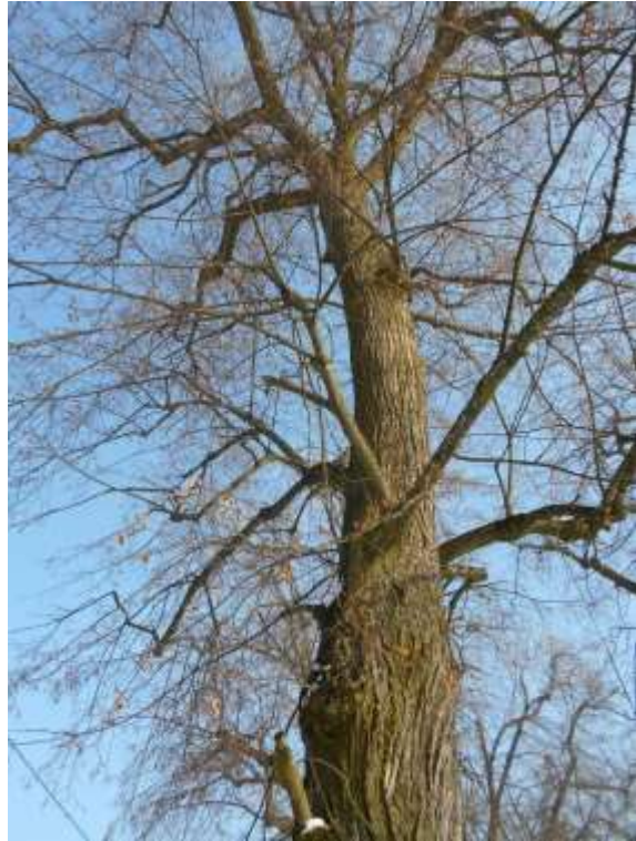
Lipa drobnolistna nr inw. 30