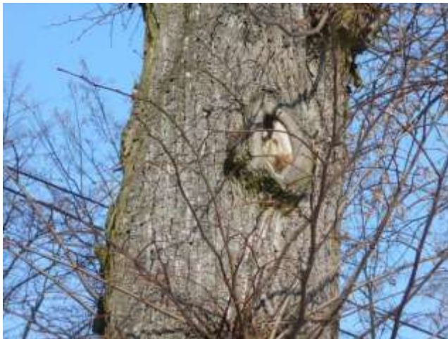
Lipa drobnolistna nr inw. 22